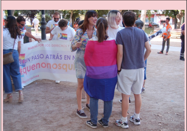
Colectivo "Don Benito Orgullosa" en el Día del Orgullo 2022, en Mérida

La bandera LGTBQ+ inclusiva es la fusión de las banderas arco iris, trans e intersex añadiendo una banda marrón por el movimiento BLM 18 y otra negra por las víctimas del SIDA. Es una expresión gráfica de la interseccionalidad del concepto queer.