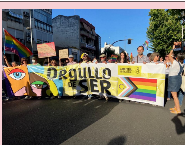
Pancarta de Amnistía Internacional en el Día del Orgullo de 2022, en Mérida