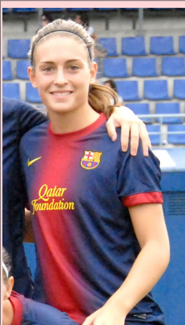
Alexia Putellas