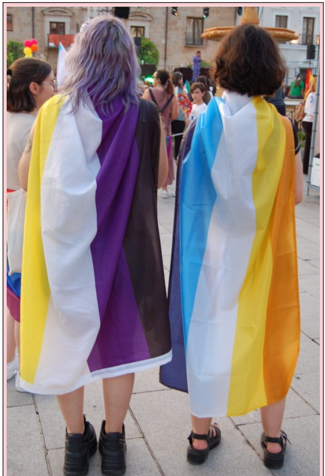
Banderas no binarie y aroace en la celebración del Día del Orgullo, en Mérida, en 2023.

El espectro aroace incluye a todas las personas que se incluyen en los espectros arromántico y asexual.